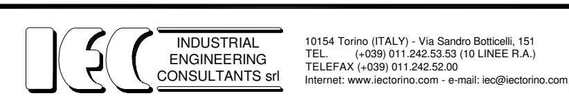
TAVOLA 7 REV. 1

COMUNE DI OULX (TO) PIANO DI CLASSIFICAZIONE ACUSTICA DEL TERRITORIO COMUNALE